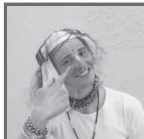
„Krisnás vagyok, láthatja!”